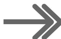
Smerová šípka pre vzdialený cieľ